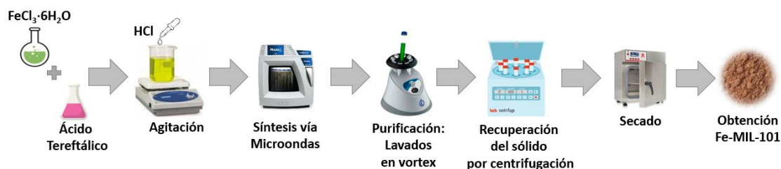
Figura 1. Esquema general de la síntesis asistida por microondas del Fe-MIL-101.

La síntesis de Fe-MIL-101 consistió en disolver en 42 mL de dimetilformamida (DMF), cloruro férrico hexahidratado ( \text{FeCl}_3 \cdot 6\text{H}_2\text{O} ) y ácido tereftálico, en una proporción molar (1:1). La mezcla se agitó durante 10 min, añadiendo posteriormente 1 mL de ácido acético, y se continuó la agitación a temperatura ambiente por 30 min. En la segunda etapa, la solución se distribuyó en 6 tubos de teflón especializados para radiación microondas, en volúmenes iguales, y se sometieron a una temperatura de 150^\circ\text{C} por 30 min en un equipo CEM Mars 6 Microwave. Tras el enfriamiento a temperatura ambiente, se procedió a una etapa de purificación del material mediante lavados sucesivos con DMF, metanol y agua, con movimientos vibratorios en un agitador múltiple Vortex durante 2 min por lavado con centrifugación intermedia para eliminar residuos de solventes y reactivos sin reaccionar. Finalmente, el sólido recuperado se secó a 85^\circ\text{C} por 12 h (ver Figura 1).